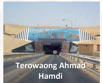
Terowong Ahmad Hamdi

CAIRO Sarapan – Makam dan Masjid imam As-Syafie – Melawat masjid Saidina Amru Al-Asr.