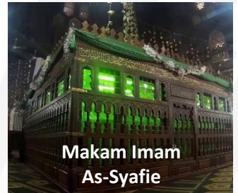
Makam Imam As-Syafie

MALAYSIA (Transit bergantung kepada jenis penerbangan) Berlepas dari KLIA ke Cairo.